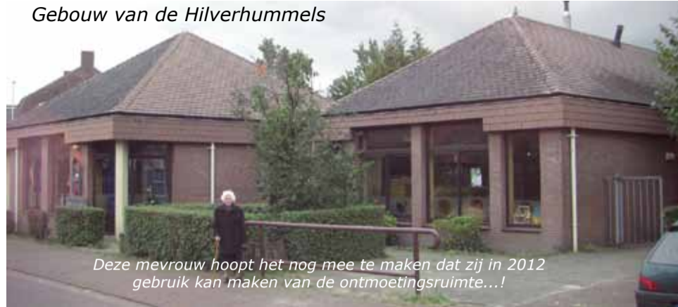
Deze mevrouw hoopt het nog mee te maken dat zij in 2012 gebruik kan maken van de ontmoetingsruimte...!